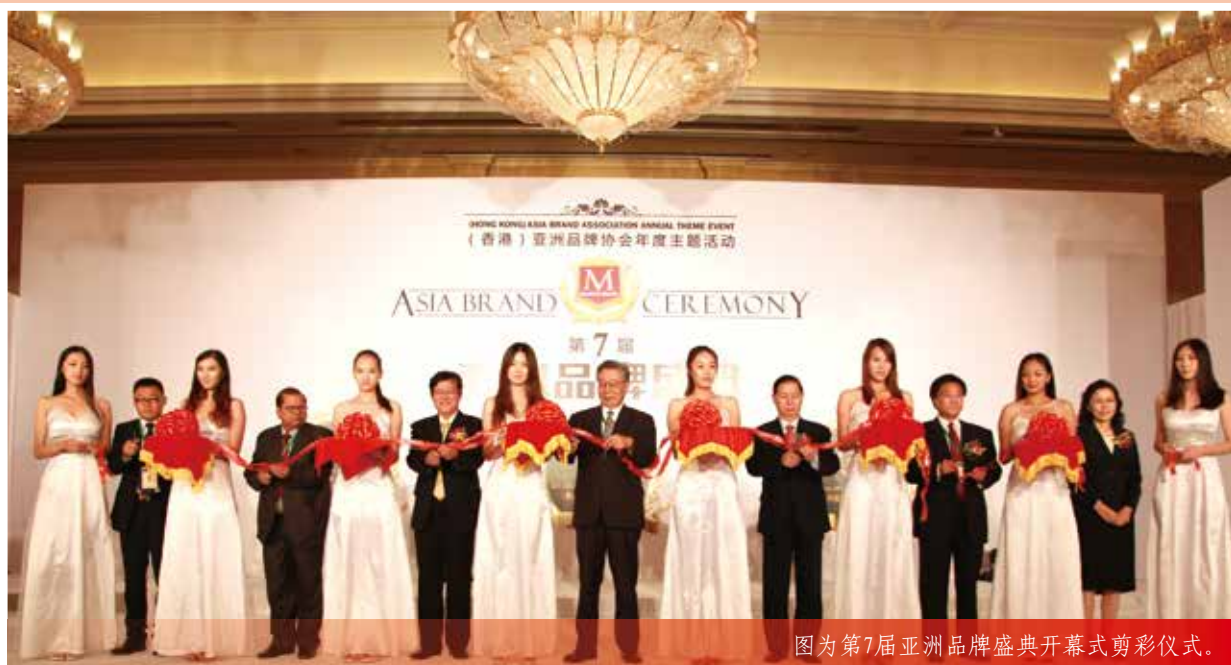
图为第7届亚洲品牌盛典开幕式剪彩仪式。

本报讯 9月9日，亚洲品牌年度“奥斯卡”大奖推选活动——第8届亚洲品牌盛典将在香港隆重举行。本届活动以“集聚亚洲品牌新动力”为主题，“亚洲品牌500强”、“亚洲十大最具影响力品牌奖”、“亚洲品牌年度人物大奖”等大奖一一揭晓。