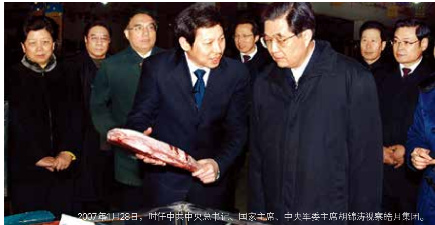
2007年1月28日，时任中共中央总书记、国家主席、中央军委主席胡锦涛视察皓月集团。

皓月公司在国内市场形成了以东北市场为主导，华北市场为延伸，辐射华东、华南、华中等地区的销售网络布局；在国际市场已形成以阿联酋为中心的中东市场、以马来西亚为中心的东南亚市场和以俄罗斯为中心的东欧市场三大销售板块。目前皓月产品出口到23个国家和地区，连续八年占全国出口量的